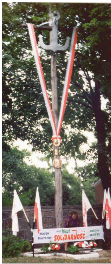
Ryc. 2 Grajewski Krzyż Solidarności w sierpniu 1996 r.