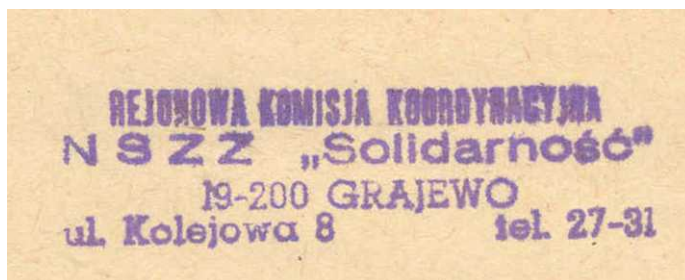
Ryc. 1 Odbitka pieczętki nagłówkowej RKK „Solidarność” w Grajewie

Równocześnie trwała mobilizacja wewnętrzna w PZPR