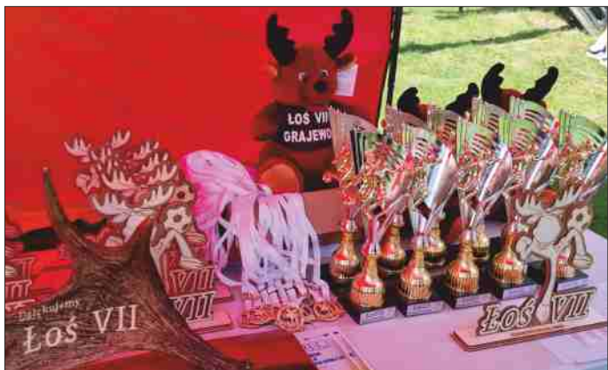
WM na podst. https://mosingrajewo.pl/turniej-los-vii/