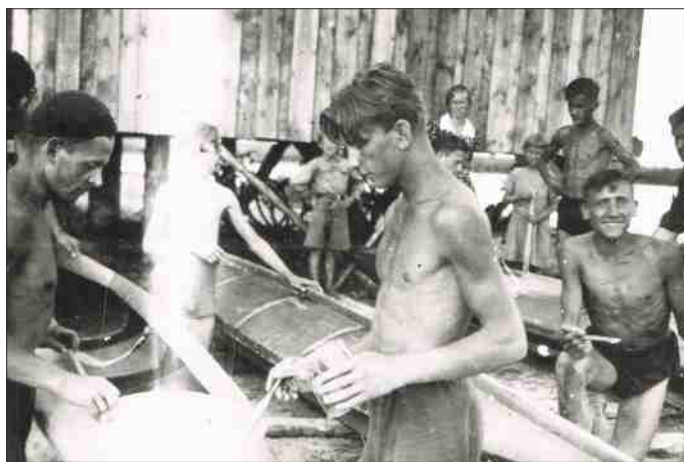
Remont i budowa kajaków przy przystani nad rz. Elk – 1935 r.

Sprawia to piekielny ból (...) „Płeć słabsza” widząc naszą ciężką, choć skuteczną walkę z falami i prądem, chwytła za zapasowe wiosło i dalejże do roboty. Odnosi to ten skutek, że po godzinie jazdy ręką ruszyć nie może.”