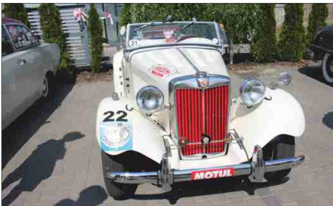
WM na podst. grajewo.pl