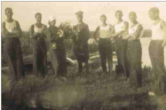
Uczestnicy spływu kajakowego Grajewo – Warszawa – Grajewo po powrocie z wyprawy – 1936 r.

Po pierwsze nie dopisała pogoda- przez kilka czerwcowych dni gwałtowne burze były normą, a przez następne panował nieznośny wręcz upał. Po drugie z niewprawionych w wiosłowaniu i sterowaniu dodatkowych pasażerów było mniej pożytku, a więcej kłopotu, gdyż już po dwóch dniach „obolałe mięśnie i porośnięte bolesnymi bąblami dłonie nie pozwalają wykonać najmniejszego ruchu bez syknięcia i zgrzytu zębami. (...) Ramiona prężą się od wysiłku pracy. Bąble na dłoniach pod nacisnięciem wiosła pękają, a na ich miejsca wyrastają drugie.