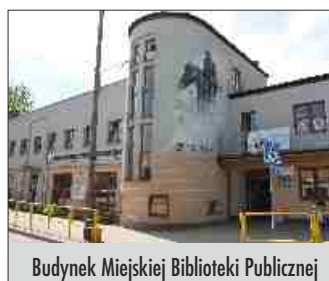
Budynek Miejskiej Biblioteki Publicznej

- Bardzo proszę. Udało się nam wyremontować wiele starych dróg, a nawet rozpocząć budowę nowych. Dzięki rządowemu wsparciu