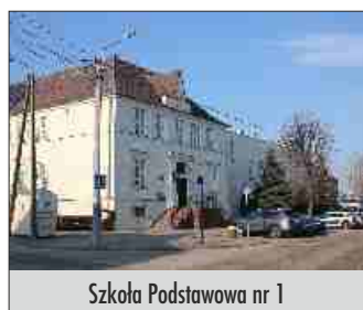
Szkoła Podstawowa nr 1

przeprowadzane są intensywne prace wodno-kanalizacyjne. Nasze szkoły otrzymują nowoczesny sprzęt informatyczny: komputery, laptopy, pracownice multimedialne. Dużym wsparciem cieszy się także szpital w Grajewie. Nie można zapomnieć o dwóch naszych sztandarowych projektach. Mam tu na myśli rozpoczęcie procesu remontu dworca PKP w Grajewie oraz budowę jednostki Wojska Polskiego.