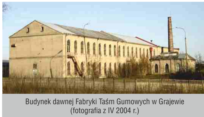
Budynek dawnej Fabryki Taśm Gumowych w Grajewie (fotografia z IV 2004 r.)