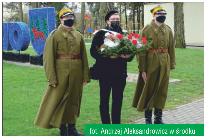
fot. Andrzej Aleksandrowicz w środku

Obecność 9 Pułku Strzelców Konnych w Grajewie ma swoją historię, tradycję. Można śmiało powiedzieć, że ta historia trwa, jest kontynuowana i kultywowana właśnie przez Towarzystwo. Jak