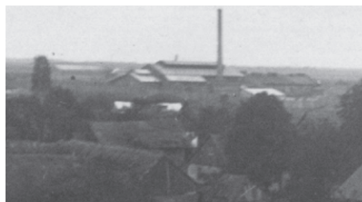
Budynek Huty szkła „Janina” w okresie międzywojennym