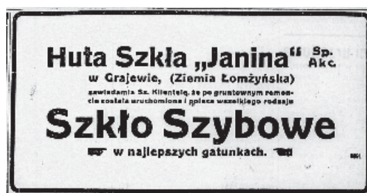
Reklama grajewskiej huty w „Dzienniku Poznańskim” nr 298 z 28.12.1928 r.