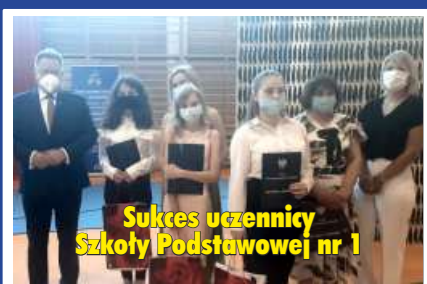
Sukces uczniocy Szkoły Podstawowej nr 1