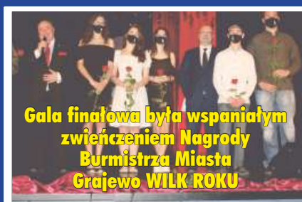
Gala finałowa była wspaniałym zwieńczeniem Nagrody Burmistrza Miasta Grajewo WILK ROKU