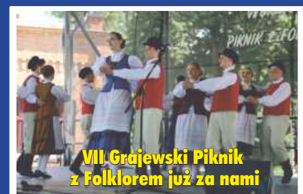
VII Grajewski Piknik z Folklorem już za nami