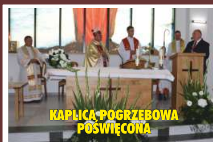
KAPLICA POGRZEBOWA POŚWIĘCONA