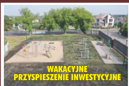
WAKACYJNE PRZYSPIESZENIE INWESTYCYJNE