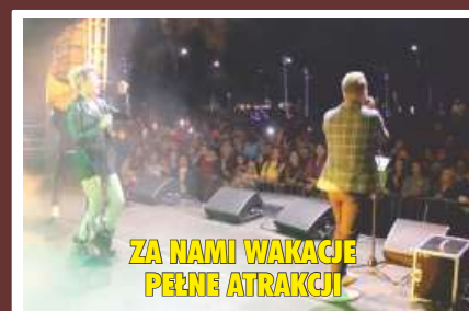
ZA NAMI WAKACJE PEŁNE ATRAKCJI