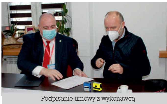
Podpisanie umowy z wykonawcą

brukowej, wjazdów z czerwonej kostki brukowej, oznakowania pionowego oraz przebudowie istniejącego przepustu. W ramach działań położona zostanie również kanalizacja deszczowa oraz kanalizacja sanitarna.