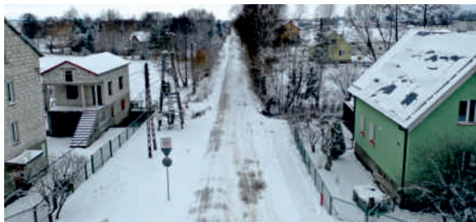
Ulica 11 Listopada wkrótce będzie lepiej służyła jej użytkownikom

Inwestycja polegać będzie na wykonaniu robót drogowych na 655-metrowym odcinku od skrzyżowania z ul. Wierzbową, obejmujących swym zakresem między innymi budowę jezdni z szarej kostki brukowej, chodnika z szarej kostki