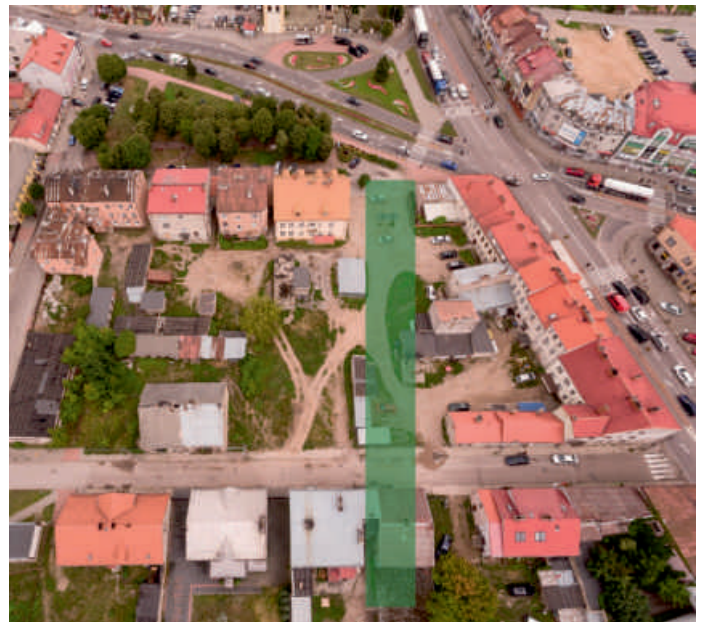
Kolorem zielonym zaznaczono obszar planowanego deptaka reprezentacyjnego. Wsparcie z RFIL-u pomoże go zbudować.

Pierwszy wniosek związany jest z realizacją inwestycji polegających na rozbudowie w Grajewie sieci kanalizacji sanitarnej w siedemnastu ulicach: Legionistów, Spokojnej, Ułańskiej, Perlitza, Sztramko, Jana Pawła II, Św. Józefa, Św. Piotra, Św. Marka, Św. Floriana, Św. M. Kolbe, Siedzikówny „Inki”, Kościelnej, Grabowskiego, Tabortowskiego, Piłsudskiego (odcinek od Bocznej do Kolejowej) oraz Miłej. Wniosek ten zakłada także rozbudowę sieci wodociągowej w dziesięciu ulicach: Jana Pawła II, Św. Józefa, Św. Piotra, Św. Marka, Św. Floriana, Św. M. Kolbe, Siedzikówny „Inki”, Grabowskiego, Tabortowskiego oraz Piłsudskiego (odcinek od Bocznej do Kolejowej). Koszt tych inwestycji został oszacowany na 5 mln 340 tys. zł. Drugi ze złożonych wniosków dotyczy inwestycji, która polega na modernizacji budynków komunalnych wielorodzinnych w Grajewie przy ulicach: Piłsudskiego, Traugutta, Kilińskiego i Elckiej. Inwestycja zakłada głęboką modernizację energetyczną z remontem zdegradowanych elementów zewnętrznych i wewnętrznych wraz z doposażeniem w brakujące instalacje oraz przyłącza do sieci miejskich siedmiu wielorodzinnych budynków komunalnych, znajdujących się w ścisłym historycznym centrum Grajewo. Szacowany koszt tej inwestycji to 5 mln 260 tys. zł. Trzeci wniosek dotyczy rozbudowy miejskiej sieci wodociągowej i kanalizacji sanitarnej w ulicach