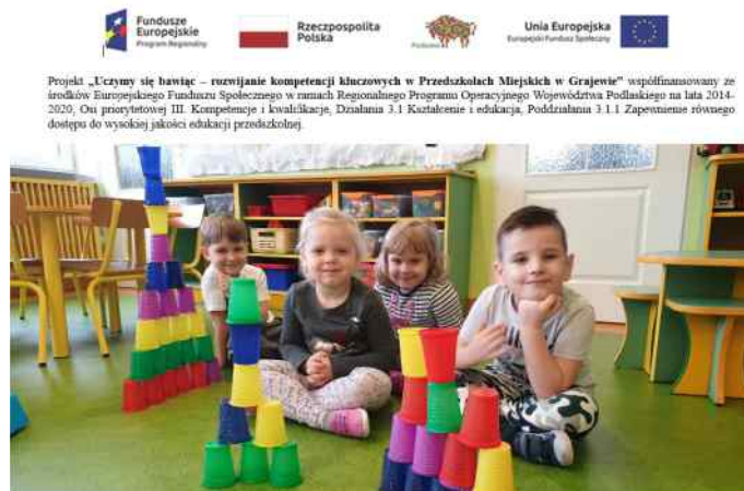
Projekt „Uczymy się bawiąc – rozwijanie kompetencji kluczowych w Przedszkolach Miejskich w Grajewie” współfinansowany ze środków Europejskiego Funduszu Społecznego w ramach Regionalnego Programu Operacyjnego Województwa Podlaskiego na lata 2014-2020, Osi priorytetowej III. Kompetencje i kwalifikacje, Działania 3.1. Kształcenie i edukacja, Poddziałania 3.1.1. Zapewnienie równego dostępu do wysokiej jakości edukacji przedszkolnej.

Przy użyciu robotów Ozobot, tablic multimedialnych, ściany interaktywnej oraz mat do kodowania rozwijały miękkie kompetencje (umiejętność pracy zespołowej, logiczne, algorytmiczne myślenie, zadaniowe podejście do stawianych problemów), kształtowały postawy prozdrowotne, zwracały dużą uwagę na bezpieczne poruszanie się po drogach, rozwijały kreatywność, oraz myślenie przyczynowo - skutkowe. Kształtowały umiejętność kodowania informacji przy pomocy sekwencji barw. Rozwijały sprawności manualne, doskonaliły percepcję słuchową, rozwijały umiejętność uważnego słuchania, rozbudzały wyobraźnię oraz inwencję twórczą poprzez zabawy konstrukcyjne, doskonaliły liczenie i orientację przestrzenną. Ćwiczyły również współdziałanie w zespołach i koncentrację uwagi. Doskonaliły umiejętności określania kierunków, rozwijały zaintereso-