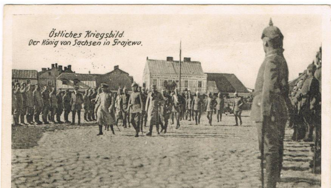
Wizyta księcia Saksonii w Grajewie w V 1915 r.

Ówczesne położenie Grajewa i powiatu szczuczńskiego, graniczącego bezpośrednio z terenami Prus Wschodnich, spowodowało, że wydarzenia I wojny światowej bardzo szybko dotarły na jego teren. Dodatkowym faktem, który wpłynął na to, że szczególnie boleśnie odczuł jej skutki było to, iż jego tereny stanowiły bezpośrednie przedpole istotnej ze strategicznego punktu widzenia rzeki Biebrzy i broniącej przeprawy przez nią twierdzy Osowiec.