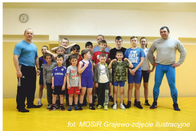
fol. MOSiR Grajewo-zdjęcie ilustracyjne