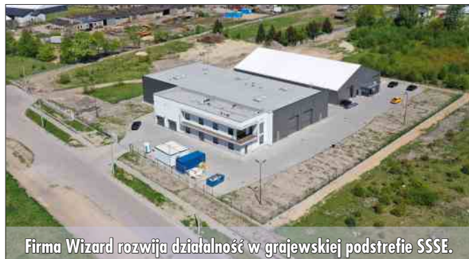
Firma Wizard rozwija działalność w grajewskiej podstrefie SSSE.