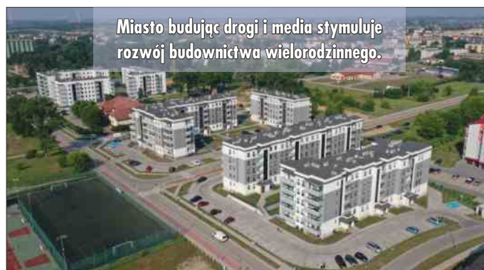
Miasto budując drogi i media stymuluje rozwój budownictwa wielorodzinnego.