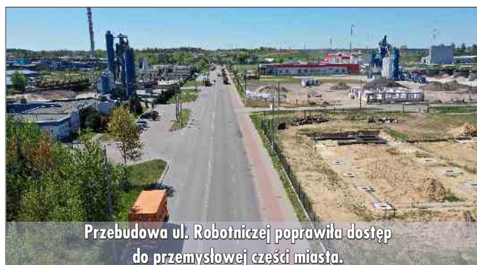
Przebudowa ul. Robotniczej poprawiła dostęp do przemysłowej części miasta.