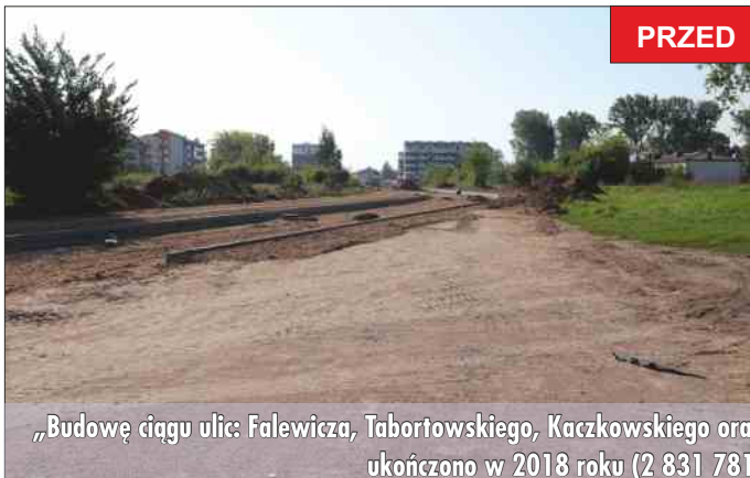
„Budowę ciągu ulic: Falewicza, Tabortowskiego, Kaczkowskiego oraz DP1 na os. Jana Pawła II w Grajewie” ukończono w 2018 roku (2 831 781,10 zł).