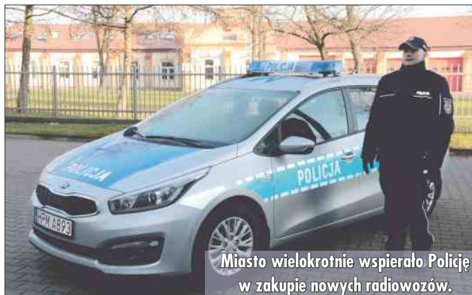
Miasto wielokrotnie wspierało Policję w zakupie nowych radiowozów.