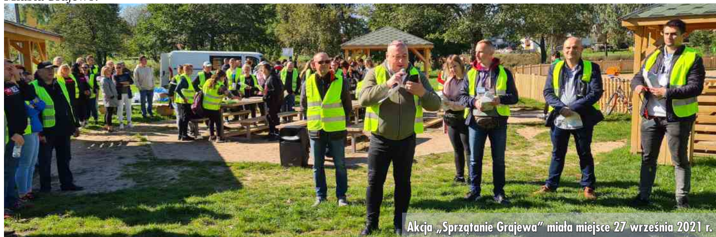
Akcja „Sprzątanie Grajewo” miała miejsce 27 września 2021 r.