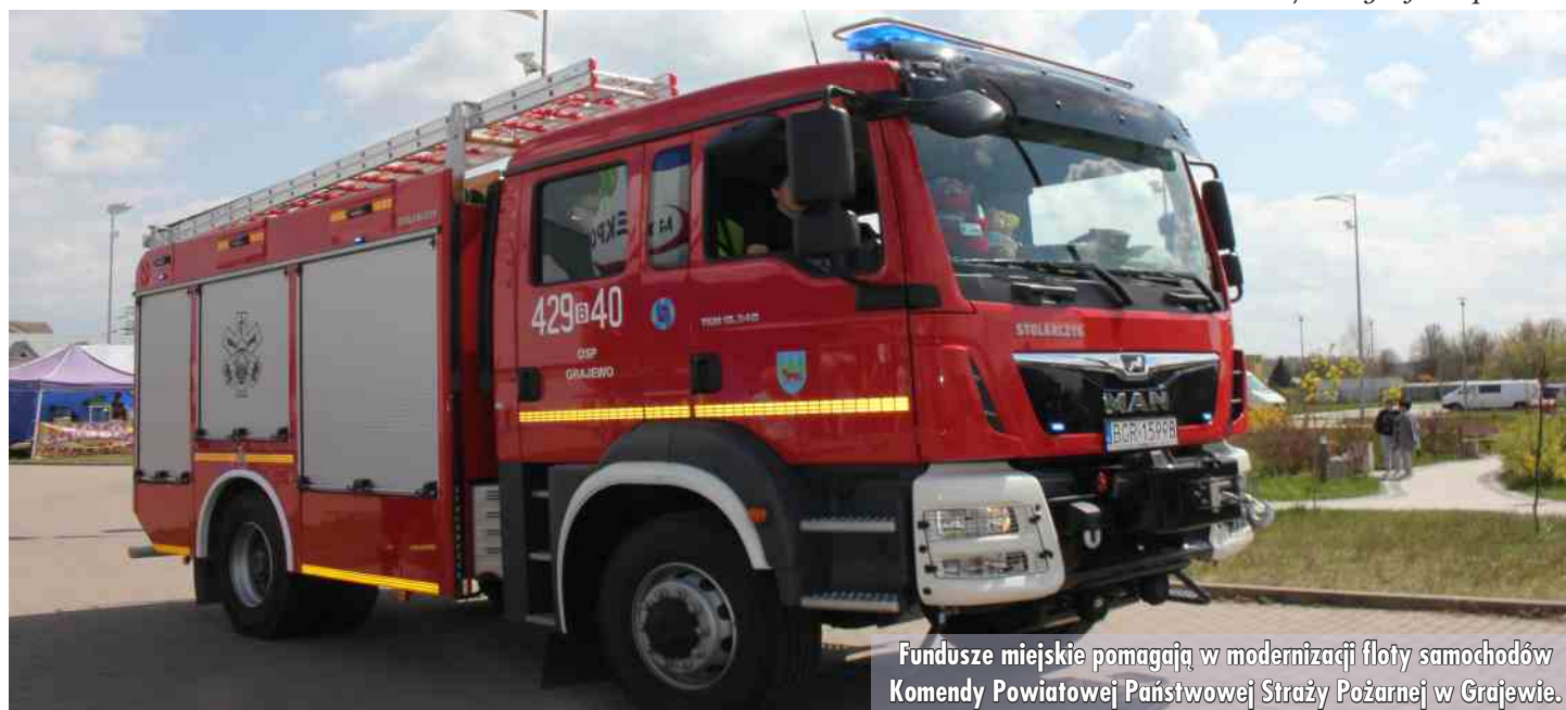
Fundusze miejskie pomagają w modernizacji floty samochodów Komendy Powiatowej Państwowej Straży Pożarnej w Grajewie.