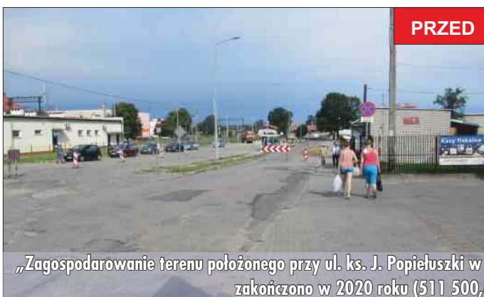
„Zagospodarowanie terenu położonego przy ul. ks. J. Popieluszki w ramach rewitalizacji centrum Grajewa” zakończono w 2020 roku (511 500,68 zł).