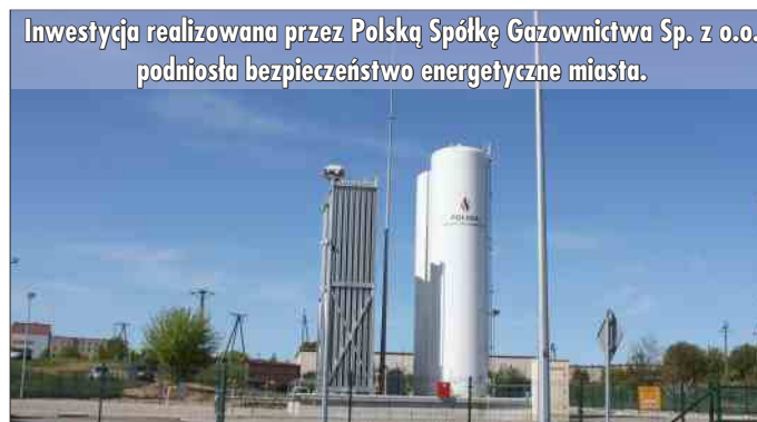
Inwestycja realizowana przez Polską Spółkę Gazownictwa Sp. z o.o. podniosła bezpieczeństwo energetyczne miasta.