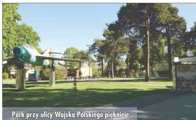
Park przy ulicy Wojska Polskiego pięknieje.