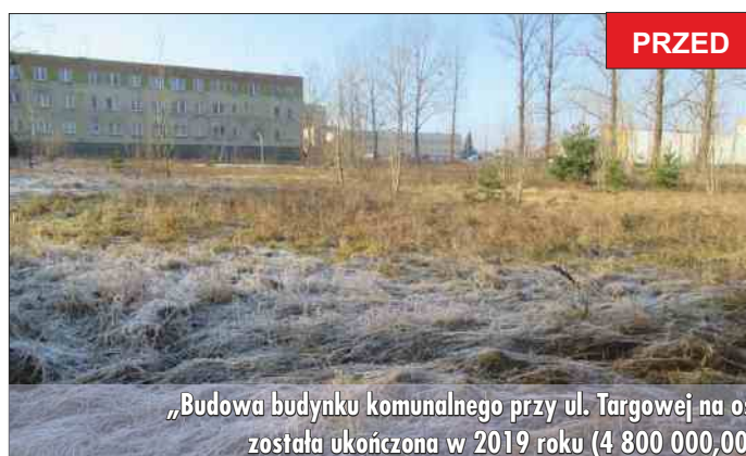
„Budowa budynku komunalnego przy ul. Targowej na os. Południe” została ukończona w 2019 roku (4 800 000,00 zł).