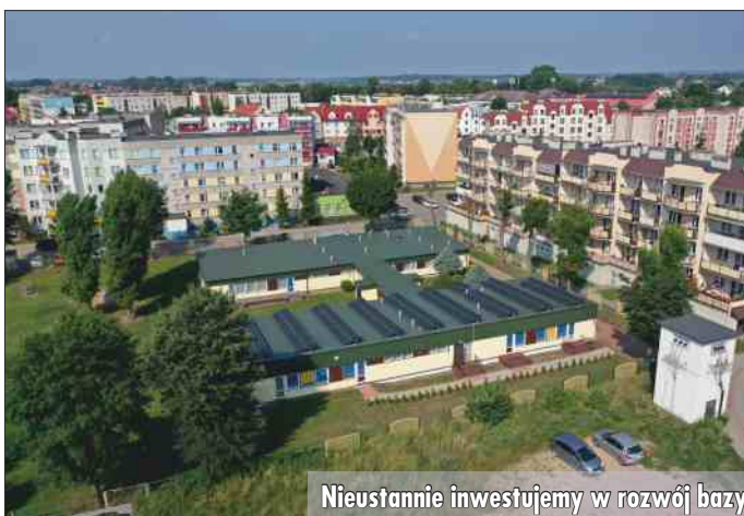
Nieustannie inwestujemy w rozwój bazy lokalowej miejskich szkół i przedszkoli.

W Grajewie na zakończenie roku szkolnego organizowane są także pikniki rodzinne pod hasłem: „Witamy Wakacje”. Strefa rodzinna Parku Solidarności służy zabawie z animatorami dla dzieci, jest grill z kiełbaskami i wata cukrowa.