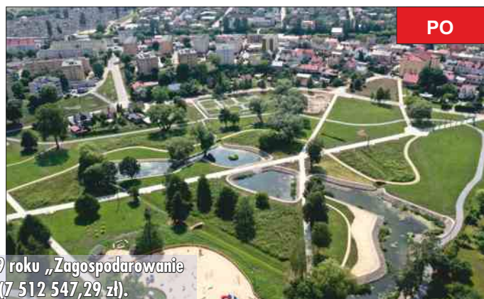
Najkosztowniejszą inwestycją w Parku Solidarności było ukończone w 2019 roku „Zagospodarowanie Parku Solidarności oraz tworzenie terenów zielonych w Grajewie” (7 512 547,29 zł).

Przez ostatnich niemal 8 lat zostało zrealizowanych w Grajewie już ponad 170 inwestycji za ponad 177 milionów złotych. To kilometry nowych i lepszych ulic, chodników, coraz dłuższa sieć kanalizacji i wodociągów oraz parki i place zabaw. Wszystko po to, by grajewianie po każdym ukończonym przedsięwzięciu mogli powiedzieć: „Jest lepiej w moim mieście”.