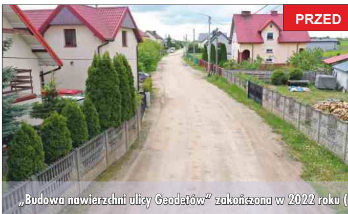
„Budowa nawierzchni ulicy Geodetów” zakończona w 2022 roku (1 291 870,87 zł).