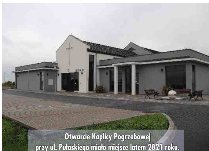
Otwarcie Kaplicy Pogrzebowej przy ul. Pułaskiego miało miejsce latem 2021 roku.