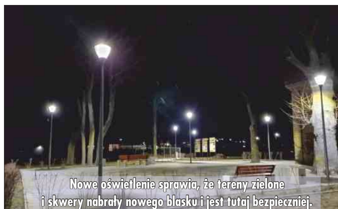
Nowe oświetlenie sprawia, że tereny zielone i skwery nabrały nowego blasku i jest tutaj bezpieczniej.