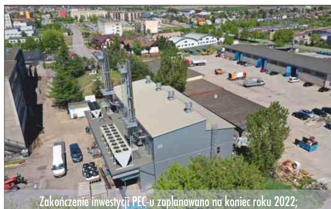
Zakończenie inwestycji PEC-u zaplanowano na koniec roku 2022;

Ta spółka zajmuje się oczyszczaniem dróg, odbiorem odpadów, usługami asenizacyjnymi, utrzymaniem we właściwym stanie zieleni miejskiej. Do tego dochodzą usługi cmentarne i pogrzebowe. W odpowiedzi na potrzeby mieszkańców w ubiegłym roku Przedsiębiorstwo Usług Komunalnych zakończyło budowę budynku usługowego z przeznaczeniem na cele kultu religijnego (kaplica pogrzebowa) wraz z infrastrukturą. Realizacja tego przedsięwzięcia wiązała się z wydatkiem rzędu 3 000 000,00 PLN. Cały kompleks, którego powierzchnia to około 1000 metrów kwadratowych, został zlokalizowany na nowo wybudowanej kwaterze. Powstały 2 klimatyzowane sale pogrzebowe, kaplica do nabożeństw oraz pomieszczenia niezbędne, by wykonać kompleksową usługę pogrzebową, tj. chłodnie, przebieralnię czy sklep z pełnym asortymentem pogrzebowym – trumnami, urnami, odzieżą, obuwaniem, tabliczkami, wieńcami i zniczami.