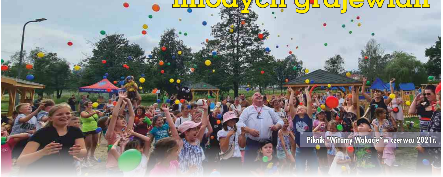
Piknik "Witamy Wakacje" w czerwcu 2021r.

Jeszcze w tym roku zakończy się budowa łącznika w Szkole Podstawowej nr 1. Inwestycji, których celem jest podniesienie warunków, w jakich uczą się uczniowie grajewskich szkół miejskich oraz spędzają czas przedszkolaki nie brakowało również w latach ubiegłych. To między innymi: budowa oświetlenia awaryjnego w budynkach przedszkoli nr 1 i 4 czy przebudowa klatki schodowej przedszkola nr 6, budowa nawierzchni przy budynku Zespołu Szkół Miejskich nr 3, czyli obecnej Szkole Podstawowej nr 4. Na uwagę zasługuje także utworzenie 2 lata temu dodatkowego oddziału żłobkowego w przedszkolu nr 2. W ramach projektu sala żłobka została wyremontowana i wyposażona w niezbędne meble, pomoce dydaktyczne i zabawki. Powstała też łazienka dostosowana do potrzeb maluchów.