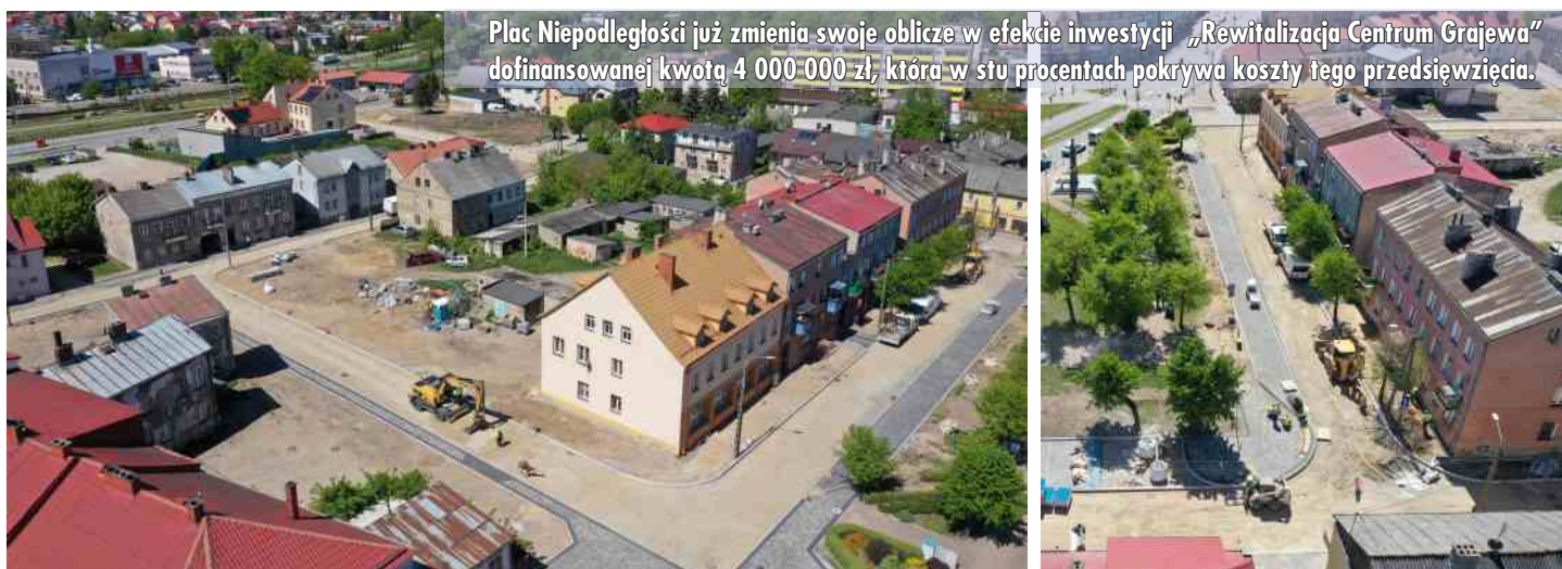
Plac Niepodległości już zmienia swoje oblicze w efekcie inwestycji „Rewitalizacja Centrum Grajewo” dofinansowanej kwotą 4 000 000 zł, która w stu procentach pokrywa koszty tego przedsięwzięcia.

WM na podst. grajewo.pl, funduszeuropejskie.gov.pl