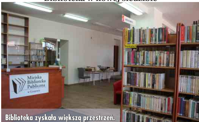
Biblioteka zyskała większą przestrzeń.

17 stycznia tego roku Wypożyczalnia dla Dorosłych wznowiła działalność pod nowym adresem przy ulicy Elkiej 30, po przeprowadzce z obiektu przy ulicy Wojska Polskiego 20 i gruntownym remoncie pomieszczeń w nowym budynku. Większy komfort zyskali grajewianie korzystający z biblioteki, ponieważ jest tam bardziej funkcjonalnie, przybyło przestrzeni oraz wydawnictw.