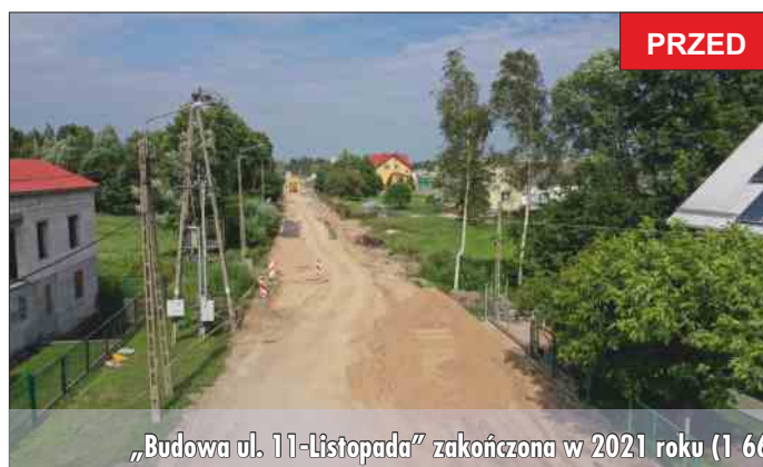
„Budowa ul. 11-Listopada” zakończona w 2021 roku (1 669 846,77 zł).