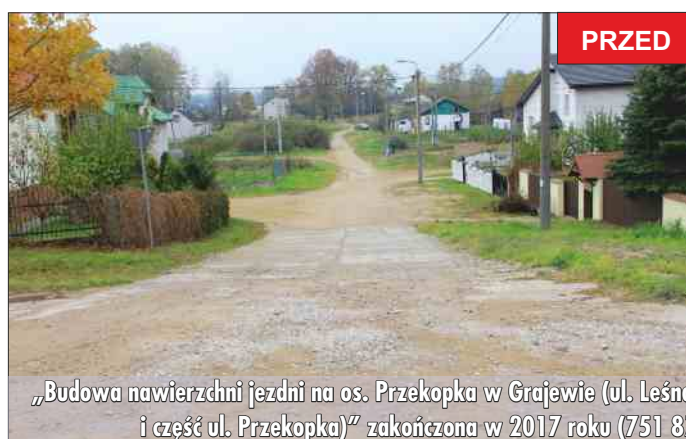
„Budowa nawierzchni jezdni na os. Przekopka w Grajewie (ul. Leśna, część ul. Grzybowej i część ul. Przekopka)” zakończona w 2017 roku (751 877,51 zł).