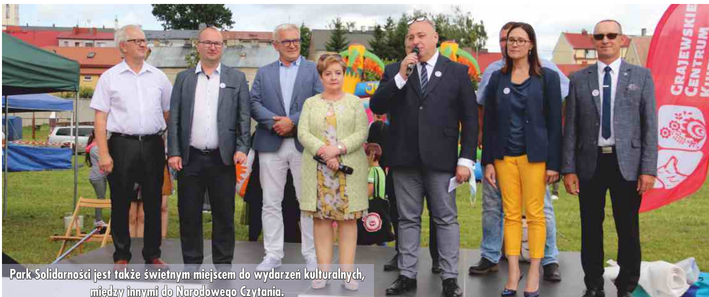
Park Solidarności jest także świetnym miejscem do wydarzeń kulturalnych, między innymi do Narodowego Czytania.

z programu Infrastruktura Domów Kultury ze środków Ministra Kultury i Dziedzictwa Narodowego, a całkowita wartość inwestycji wyniosła 369 000 zł.