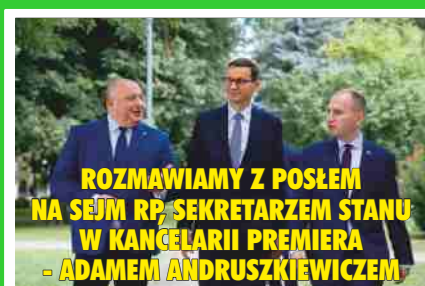
ROZMAWIAMY Z POSŁEM NA SEJM RP, SEKRETARZEM STANU W KANCELARII PREMIERA - ADAMEM ANDRUSZKIEWICZEM