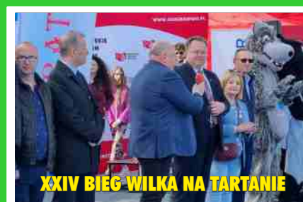
XXIV BIEG WILKA NA TARTANIE