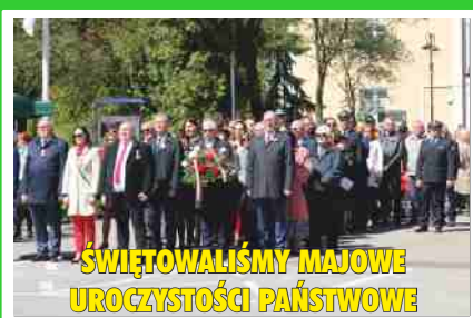
ŚWIĘTOWALIŚMY MAJOWE UROCYŚCZOŚCI PAŃSTWOWE