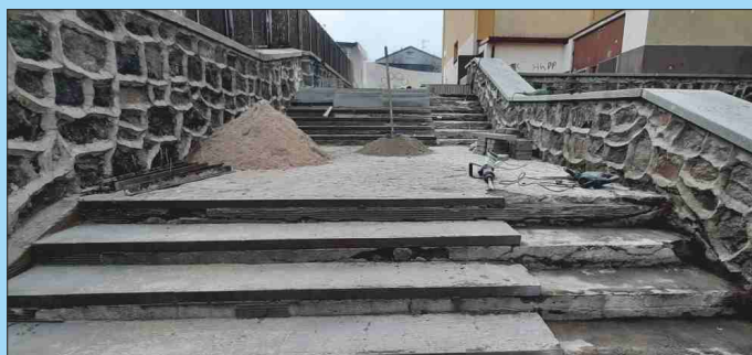
REMONT SCHODÓW ZEWNĘTRZNYCH PRZY BUDYNKU GRAJEWSKIEGO CENTRUM KULTURY

Remont nawierzchni chodników w ul. Kolejowej