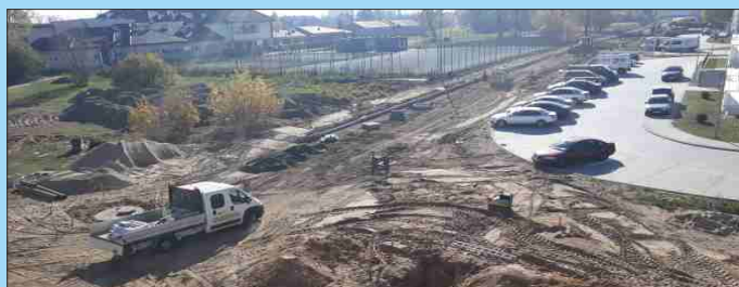
BUDOWA CIĄGU ULIC: FALEWICZA, TABORTOWSKIEGO, KACZKOWSKIEGO ORAZ DPI NA OS JANA PAWŁA II W GRAJEWIE

Wykonanie systemu monitoringu wizyjnego w Grajewie w ramach Budżetu Obywatelskiego na 2018 rok