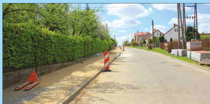
BUDOWA NAWIERZCHNI CHODNIKÓW NA OS. SZKOLNA

rekreacyjnej pn. Otwarte Strefy Aktywności Przebudowa klatki schodowej w budynku Przedszkola Miejskiego nr 6 Budowa oświetlenia awaryjnego w budynku Przedszkola Miejskiego nr 4 Budowa nawierzchni chodników na os. Huta - ETAP II Budowa nawierzchni chodników na os. Szkolna - ETAP II Poprawa bezpieczeństwa ruchu drogowego w województwie podlaskim na DK 65 w miejscowości Grajewo - w ramach PBDK - Program Likwidacji Miejsc Niebezpiecznych Rozbudowa budynku Grajewskiego Centrum Kultury o windę zewnętrzną Budowa nawierzchni jezdni w ul. Rolnej w Grajewie Budowa kanalizacji deszczowej w ul. Rolnej w Grajewie Budowa zjazdu z ul. Wyzwolenia i drogi dojazdowej na działkach nr 1103/22 i 1103/25 Budowa nawierzchni parkingu na os. Wiktorowo