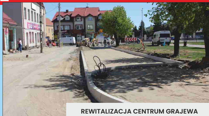
REWITALIZACJA CENTRUM GRAJEWA

Budowa sieci wodociągowej w ul. Świętego Jana Pawła II na odcinku od ul. Kościelnej w kierunku ul. Wojska Polskiego Budowa linii oświetleniowej w parku przy ul. Wojska Polskiego w Grajewie Budowa tężni solankowej w Parku Solidarności w Grajewie - Budżet Obywatelski 2022 Budowa łącznika przy Szkole Podstawowej nr 1 w Grajewie Zagospodarowanie skweru przy ul. Koszarowej w Grajewie Budowa kanalizacji sanitarnej w ul. Geodetów w Grajewie – sięgacz nr 1 Budowa budynku usługowego z przeznaczeniem na cele kultu religijnego (kaplica pogrzebowa) wraz z infrastrukturą Rewitalizacja Centrum Grajewa - współfinansowane z Rządowego Funduszu Inwestycji Lokalnych.