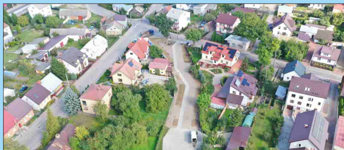
ZAGOSPODAROWANIE PARKU SOLIDARNOŚCI ORAZ TWORZENIE TERENÓW ZIELONYCH W GRAJEWIE: Utworzenie terenu zielonego przy ul. Zielonej i Koszarowej

Zagospodarowanie terenu położonego przy ul. ks. J. Popiełuszki w ramach rewitalizacji centrum Grajewo