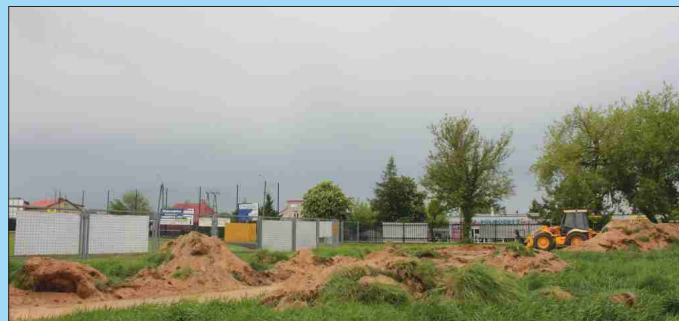
Budowa Otwartej Strefy Aktywności wraz z linią oświetleniową przy ul. Sportowej w Grajewie

Budowa ul. 11-Listopada w Grajewie Rozbudowa oświetlenia w Parku Solidarności Budowa Otwartej Strefy Aktywności wraz z linią oświetleniową przy ul. Sportowej w Grajewie Wykonanie inteligentnych, aktywnych przejść dla pieszych w ramach zadania „Poprawa bezpieczeństwa pieszych” – Budżet Obywatelski 2021 Budowa sieci wodociągowej w ul. Ekologicznej Budowa nawierzchni chodników na os. Parkowa, os. Huta, os. Szkolna w Grajewie Budowa linii oświetleniowej w mieście Grajewo Budowa nawierzchni chodnika w pasie drogowym w ul. Łaziennej w Grajewie Budowa boiska lekkoatletycznego przy Szkole Podstawowej nr 4 w Grajewie Budowa nawierzchni chodników na os. Południe Budowa ciągu ulic: Łąkowej, Stefczyka, Działkowej, Kwiatowej i Kolejowej na os. M. Konopnickiej w Grajewie Modernizacja oświetlenia ulicznego w mieście Grajewo Oświetlenie parku przy ul. Popiełuszki, Mickiewicza i Nowickiego Rewitalizacja Centrum Grajewa Remont schodów w Parku Solidarności - wejście od ulicy Konstytucji 3- go Maja w Grajewie Budowa nawierzchni ulicy Geodetów w Grajewie Budowa kanalizacji sanitarnej w obrębie ul. Kościelnej w Grajewie Budowa nawierzchni i oświetlenia w pasie drogowym 2KDX (łącznik do ul. płk Tadeusza Falewicza)