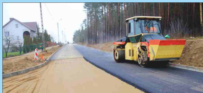
BUDOWA NAWIERZCHNI JEZDNI NA OS. PRZEKOPKA W GRAJEWIE (UL. LEŚNA, CZĘŚĆ UL. GRZYBOWEJ I CZĘŚĆ UL. PRZEKOPKA)

oraz instalacji systemu monitoringu wizyjnego w budynku Muzeum Mleka w Grajewie Przebudowa dachu budynku mieszkalnego położonego przy Pl. Niepodległości 5 i 5A Budowa oświetlenia awaryjnego w budynku Przedszkola Miejskiego nr 1 Budowa infrastruktury technicznej w ul. Ekologicznej - kanalizacja deszczowa Budowa infrastruktury technicznej w ul. Ekologicznej - sieć wodociągowa Budowa infrastruktury technicznej w ul. Ekologicznej - linia oświetleniowa Budowa oświetlenia w ul. Geodetów Budowa oświetlenia w ul. Spokojnej Budowa oświetlenia na terenie ZSM nr 3 w Grajewie Budowa infrastruktury technicznej na os. Jana Pawła II – kanalizacja deszczowa Budowa streetworkoutu w Parku Solidarności Zakup i montaż urządzeń siłowni zewnętrznej w parku Wolności i w parku przy ul. Wojska Polskiego, montaż 3 stołów szachowych betonowych i przebudowa w parku przy ul. Wojska Polskiego Remont nawierzchni jezdni i chodników w ul. Targowej