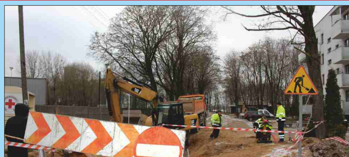
BUDOWA I PRZEBUDOWA DRÓG GMINNYCH W MIEŚCIE GRAJEWO W RAMACH PROGRAMU RZĄDOWEGO FUNDUSZU POLSKI ŁAD UL. RTM. KONOPKI

Utworzenie Punktu Obsługi Interesanta w Urzędzie Miasta Grajewo w ramach realizacji zadania pn. Zwiększenie dostępności dla osób ze specjalnymi potrzebami w Urzędzie Miasta Grajewo Budowa budynku mieszkalnego wielorodzinnego przy ul. Targowej w Grajewie Budowa budynku mieszkalnego, wielorodzinnego na osiedlu Południe w Grajewie Budowa brakujących sieci kanalizacji sanitarnej i wodociągowej w Grajewie Budowa nawierzchni chodnika w części ul. 9. Pułku Strzelców Konnych w Grajewie Budowa nawierzchni i infrastruktury technicznej w sięgaczu od ul. Skośnej i w ul. Kolektorowej - dokumentacja Budowa nawierzchni i infrastruktury technicznej w ul. 09 KD i KX na os. Jana Pawła II w Grajewie - dokumentacja Budowa nawierzchni i infrastruktury technicznej w ul. Magazynowej i J. Kochanowskiego - dokumentacja Poprawa bezpieczeństwa na przejściach dla pieszych na terenie ulic: Mickiewicza i Koszarowej w Grajewie Przebudowa dachu wraz z elementami termomodernizacji