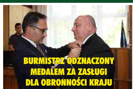
BURMISTRZ ODZNACZONY MEDALEM ZA ZASLUGI DLA OBRONNOSCI KRAJU