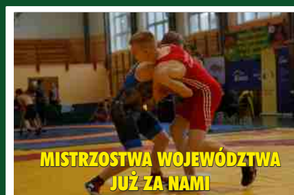
MISTRZOSTWA WOJEWODZTWA JUZ ZA NAMI