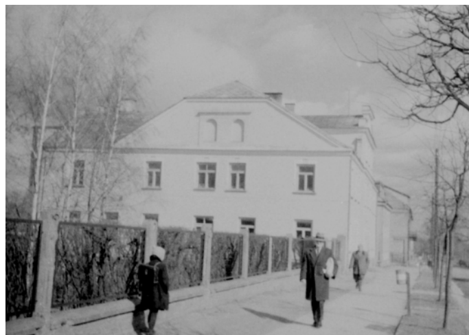
Dom Parafialny na początku lat sześćdziesiątych XX w.

Wykańczanie i wyposażanie budynku nie przebiegało jednak już tak sprawnie. W związku z tym we wrześniu 1925 r. na rzecz parafii została przekazana przez Bank Gospodarstwa Krajowego w Warszawie w formie pożyczki kwota 10.000 zł. Środki te umożliwiły zakończenie prac budowlanych i wyposażania budynku. W jednym z kolejnych z numerów „Życia i Pracy” z 1926 r. gmach ten opisywany był w następujący sposób: Jest to budynek o dwóch frontach, piętrowy, z suterrenami i facjatami. Plan pomyślany wybornie: na parterze frontowy lokal przeznaczony na gospodę chrześcijańską, w suterrenach urządzone są piekarnie, boczna ubikacja na sklepy, na piętrze mieści się duża sala ze sceną i pomieszczeniem dla maszyny pod kino, szatnia, bufet, poczekalnia, duża ilość pokoi przeznaczonych jest dla instytucji, już to dla obsługującego personelu lub do prywatnego wynajęcia, oświetlenie ma być własne (...) W tym oto domu parafialnym postarał się ks. prałat o urządzenie olbrzymiej sali, jaką niejedno większe miasto pochlubić się