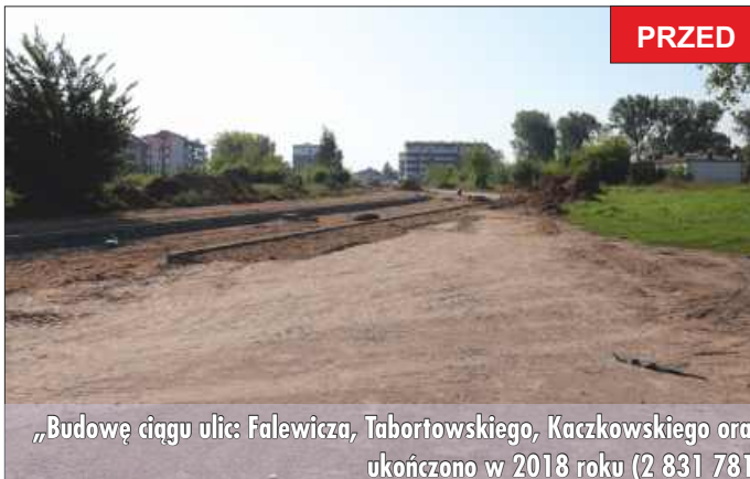
„Budowę ciągu ulic: Falewicza, Tabortowskiego, Kaczkowskiego oraz DP1 na os. Jana Pawła II w Grajewie” ukończono w 2018 roku (2 831 781,10 zł).