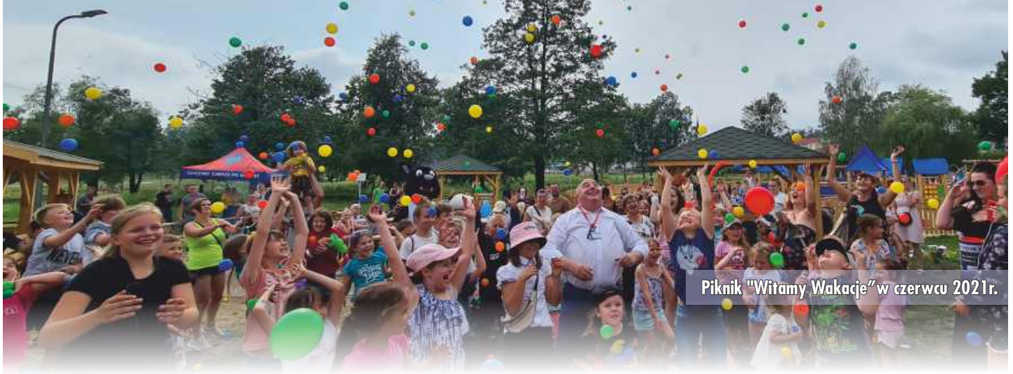
Piknik "Witamy Wakacje" w czerwcu 2021r.

Jeszcze w tym roku zakończy się budowa łącznika w Szkole Podstawowej nr 1. Inwestycji, których celem jest podniesienie warunków, w jakich uczą się uczniowie grajewskich szkół miejskich oraz spędzają czas przedszkolaki nie brakowało również w latach ubiegłych. To między innymi: budowa oświetlenia awaryjnego w budynkach przedszkoli nr 1 i 4 czy przebudowa klatki schodowej przedszkola nr 6, budowa nawierzchni przy budynku Zespołu Szkół Miejskich nr 3, czyli obecnej Szkole Podstawowej nr 4. Na uwagę zasługuje także utworzenie 2 lata temu dodatkowego oddziału żłobkowego w przedszkolu nr 2. W ramach projektu sala żłobka została wyremontowana i wyposażona w niezbędne meble, pomoce dydaktyczne i zabawki. Powstała też łazienka dostosowana do potrzeb maluchów.