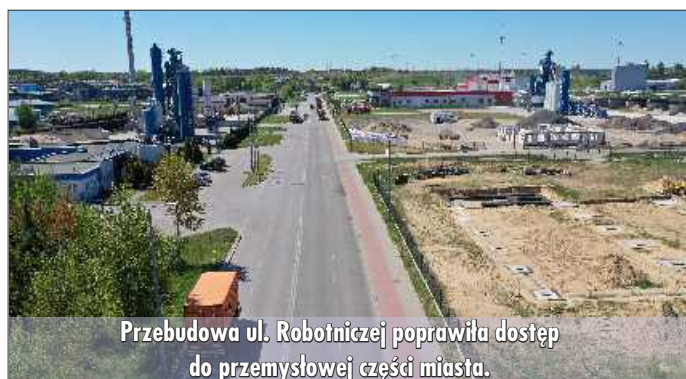
Przebudowa ul. Robotniczej poprawiła dostęp do przemysłowej części miasta.