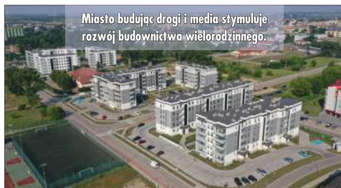
Miasto budując drogi i media stymuluje rozwój budownictwa wielorodzinnego.