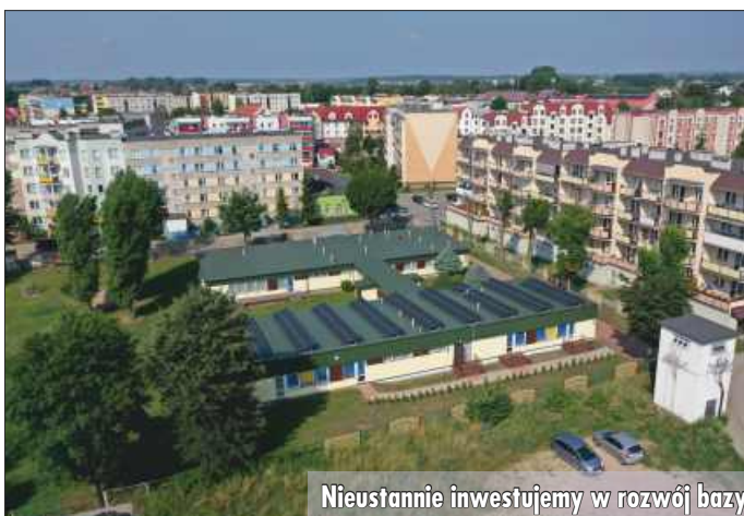
Nieustannie inwestujemy w rozwój bazy lokalowej miejskich szkół i przedszkoli.

W Grajewie na zakończenie roku szkolnego organizowane są także pikniki rodzinne pod hasłem: „Witamy Wakacje”. Strefa rodzinna Parku Solidarności służy zabawie z animatorami dla dzieci, jest grill z kiełbaskami i wata cukrowa.