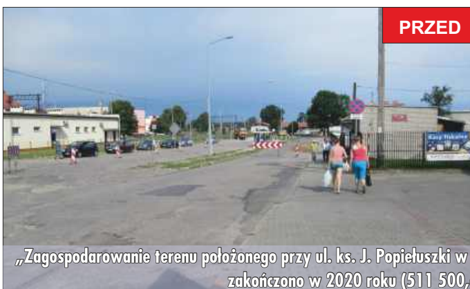
„Zagospodarowanie terenu położonego przy ul. ks. J. Popieluszki w ramach rewitalizacji centrum Grajewa” zakończono w 2020 roku (511 500,68 zł).