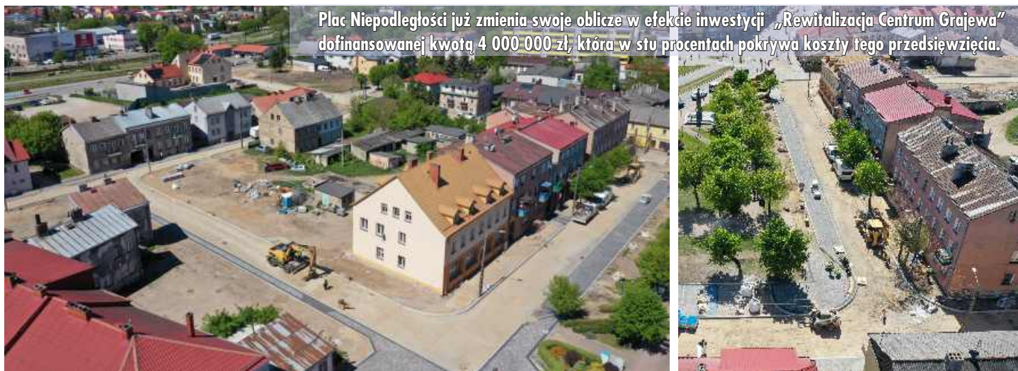
Plac Niepodległości już zmienia swoje oblicze w efekcie inwestycji „Rewitalizacja Centrum Grajewo” dofinansowanej kwotą 4 000 000 zł, która w stu procentach pokrywa koszty tego przedsięwzięcia.

WM na podst. grajewo.pl , funduszeuropejskie.gov.pl Fot. grajewo.pl