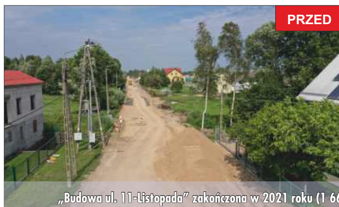
„Budowa ul. 11-Listopada” zakończona w 2021 roku (1 669 846,77 zł).