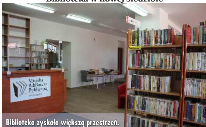
Biblioteka zyskała większą przestrzeń.

17 stycznia tego roku Wypożyczalnia dla Dorosłych wznowiła działalność pod nowym adresem przy ulicy Elkiej 30, po przeprowadzce z obiektu przy ulicy Wojska Polskiego 20 i gruntownym remoncie pomieszczeń w nowym budynku. Większy komfort zyskali grajewianie korzystający z biblioteki, ponieważ jest tam bardziej funkcjonalnie, przybyło przestrzeni oraz wydawnictw.