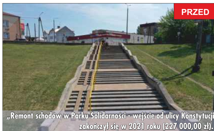
„Remont schodów w Parku Solidarności - wejście od ulicy Konstytucji 3-go Maja w Grajewie” zakończył się w 2021 roku (227 000,00 zł).