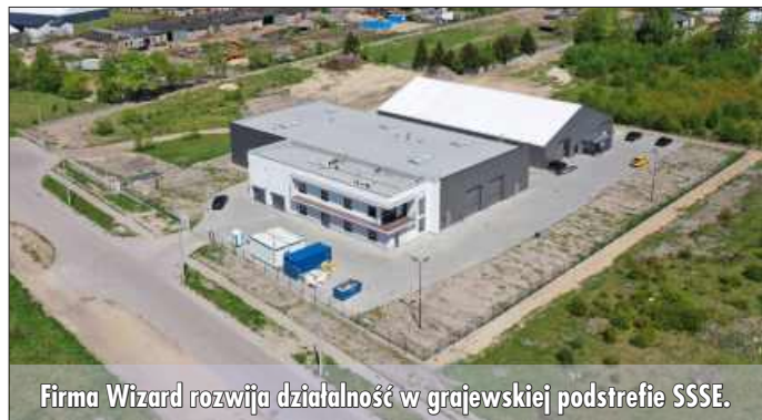
Firma Wizard rozwija działalność w grajewskiej podstrefie SSSE.