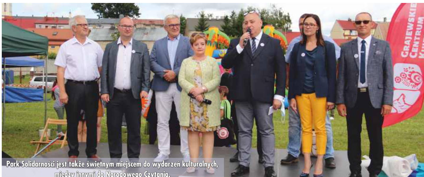
Park Solidarności jest także świetnym miejscem do wydarzeń kulturalnych, między innymi do Narodowego Czytania.

z programu Infrastruktura Domów Kultury ze środków Ministra Kultury i Dziedzictwa Narodowego, a całkowita wartość inwestycji wyniosła 369 000 zł.