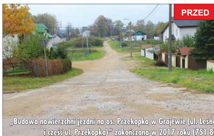
„Budowa nawierzchni jezdni na os. Przekopka w Grajewie (ul. Leśna, część ul. Grzybowej i część ul. Przekopka)” zakończona w 2017 roku (751 877,51 zł).