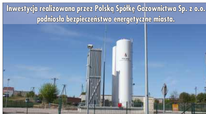
Inwestycja realizowana przez Polską Spółkę Gazownictwa Sp. z o.o. podniosła bezpieczeństwo energetyczne miasta.