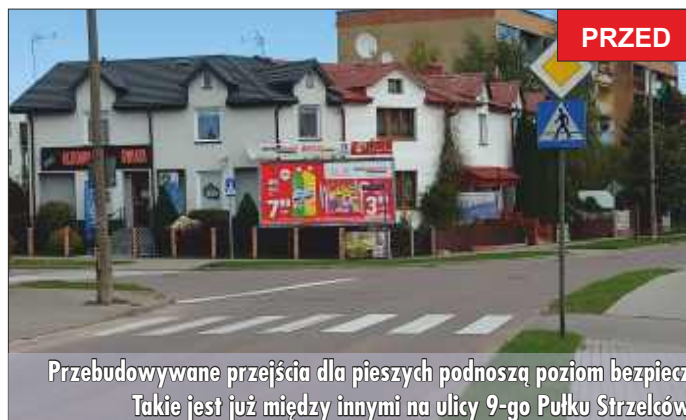
Przebudowywane przejścia dla pieszych podnoszą poziom bezpieczeństwa w mieście. Takie jest już między innymi na ulicy 9-go Pułku Strzelców Konnych.