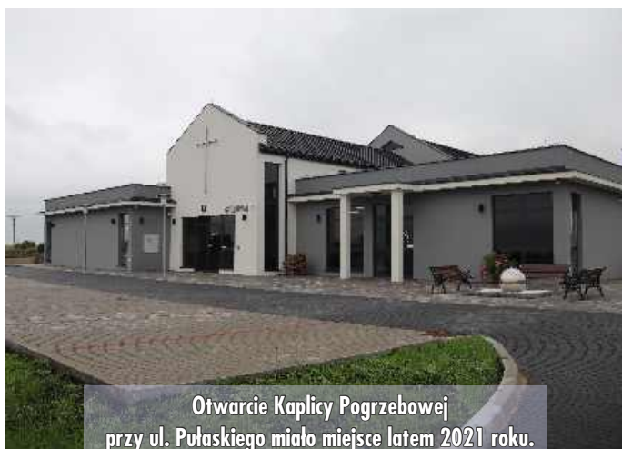
Otwarcie Kaplicy Pogrzebowej przy ul. Pułaskiego miało miejsce latem 2021 roku.