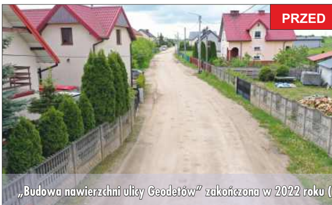
„Budowa nawierzchni ulicy Geodetów” zakończona w 2022 roku (1 291 870,87 zł).