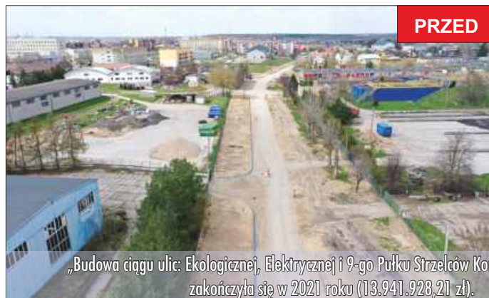
„Budowa ciągu ulic: Ekologicznej, Elektrycznej i 9-go Pułku Strzelców Konnych w Grajewie” zakończyła się w 2021 roku (13.941.928,21 zł).