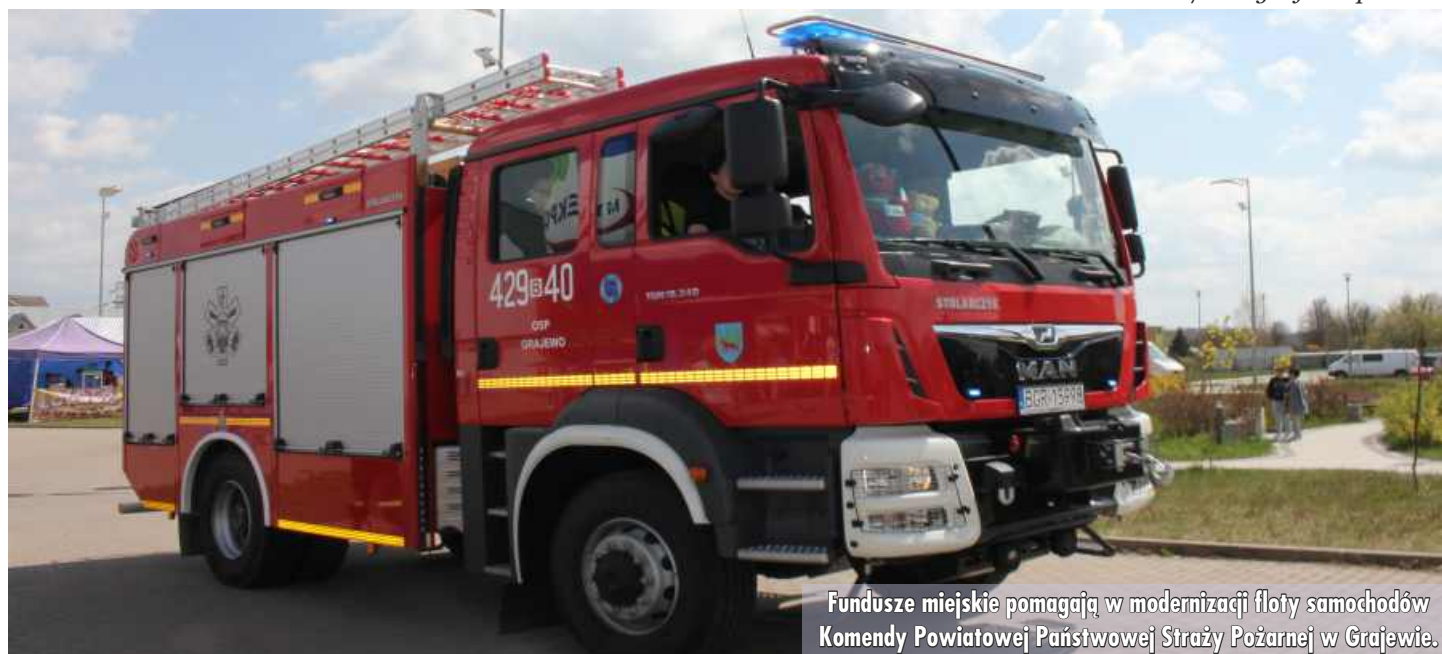
Fundusze miejskie pomagają w modernizacji floty samochodów Komendy Powiatowej Państwowej Straży Pożarnej w Grajewie.