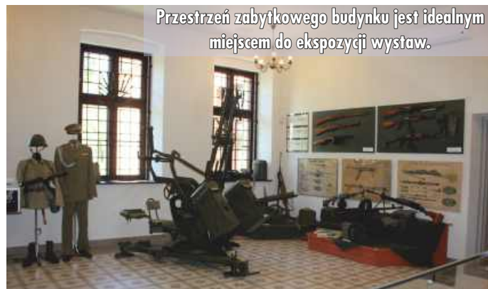
Przestrzeń zabytkowego budynku jest idealnym miejscem do ekspozycji wystaw.

Remont w nowej siedzibie Grajewskiej Izby Historycznej zakończył się jesienią 2020 roku. Inwestycji w lepszy dostęp do kultury nie zabrakło również w latach poprzednich. W 2017 roku w Grajewskim Centrum Kultury miała miejsce uroczystość oddania do użytku windy zewnętrznej, która wyeliminowała bariery architektoniczne i zwiększyła dostęp do uczestnictwa w wydarzeniach kulturalnych miasta osobom niepełnosprawnym, seniorom i rodzinom z małymi dziećmi w wózkach. Na ten cel pozyskano pieniądze z Ministra Kultury i Dziedzictwa Narodowego przy udziale środków finansowych z budżetu Urzędu Miasta Grajewa. Zadanie pn. „Rozbudowa budynku Grajewskiego Centrum Kultury o windę zewnętrzną” zostało dofinansowane w kwocie 130 000 zł