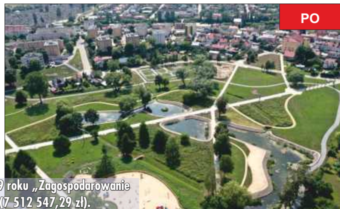
Najkosztowniejszą inwestycją w Parku Solidarności było ukończone w 2019 roku „Zagospodarowanie Parku Solidarności oraz tworzenie terenów zielonych w Grajewie” (7 512 547,29 zł).

Przez ostatnich niemal 8 lat zostało zrealizowanych w Grajewie już ponad 170 inwestycji za ponad 177 milionów złotych. To kilometry nowych i lepszych ulic, chodników, coraz dłuższa sieć kanalizacji i wodociągów oraz parki i place zabaw. Wszystko po to, by grajewianie po każdym ukończonym przedsięwzięciu mogli powiedzieć: „Jest lepiej w moim mieście”.