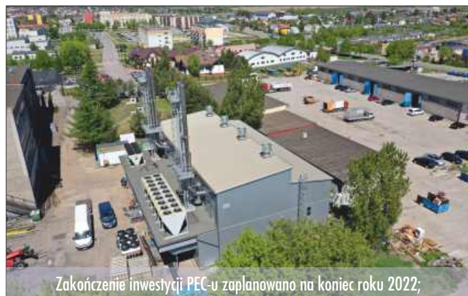
Zakończenie inwestycji PEC-u zaplanowano na koniec roku 2022;

Ta spółka zajmuje się oczyszczaniem dróg, odbiorem odpadów, usługami asenizacyjnymi, utrzymaniem we właściwym stanie zieleni miejskiej. Do tego dochodzą usługi cmentarne i pogrzebowe. W odpowiedzi na potrzeby mieszkańców w ubiegłym roku Przedsiębiorstwo Usług Komunalnych zakończyło budowę budynku usługowego z przeznaczeniem na cele kultu religijnego (kaplica pogrzebowa) wraz z infrastrukturą. Realizacja tego przedsięwzięcia wiązała się z wydatkiem rzędu 3 000 000,00 PLN. Cały kompleks, którego powierzchnia to około 1000 metrów kwadratowych, został zlokalizowany na nowo wybudowanej kwaterze. Powstały 2 klimatyzowane sale pogrzebowe, kaplica do nabożeństw oraz pomieszczenia niezbędne, by wykonać kompleksową usługę pogrzebową, tj. chłodnie, przebieralnię czy sklep z pełnym asortymentem pogrzebowym – trumnami, urnami, odzieżą, obuwaniem, tabliczkami, wieńcami i zniczami.