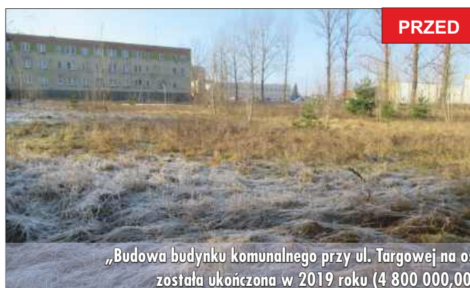
„Budowa budynku komunalnego przy ul. Targowej na os. Południe” została ukończona w 2019 roku (4 800 000,00 zł).