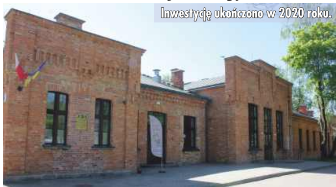
Inwestycję ukończono w 2020 roku.

Niewiele jest miast w Polsce i Europie, które mogą poszczycić się siedzibą instytucji kultury w pięknie odrestaurowanym i funkcjonalnym, ponad stuletnim budynku. U nas się to udało dzięki wspólnej determinacji kierownictwa GCK, władz miasta oraz Rady Miasta Grajewa. W efekcie tej dobrej współpracy Grajewska Izba Historyczna działa z powodzeniem w zabytkowym budynku byłego kasyna oficerskiego.