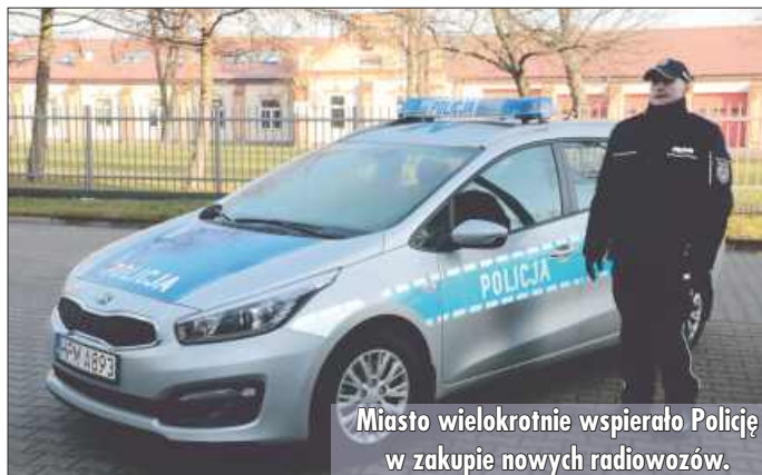
Miasto wielokrotnie wspierało Policję w zakupie nowych radiowozów.