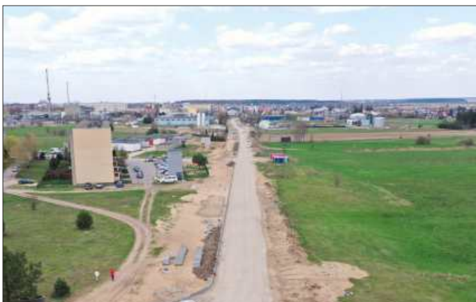
Budowa ciągu ulic: Ekologicznej, Elektrycznej i 9-go Pułku Strzelców Konnych w Grajewie

Betonowe płyty, które były zmorą kierowców, zastępuje porządna nawierzchnia.