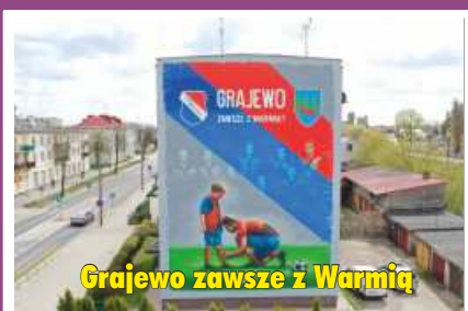
Grajewo zawsze z Warmią