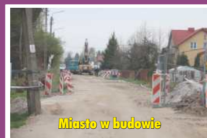
Miasto w budowie