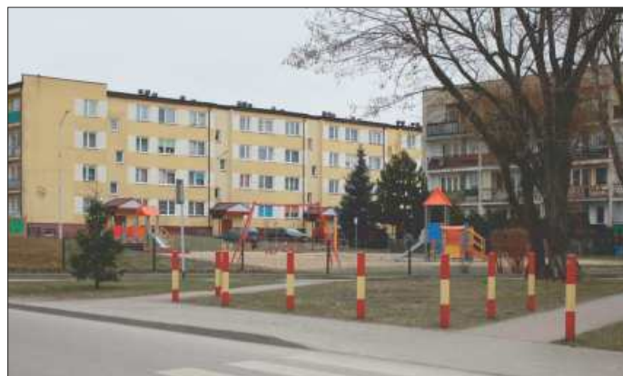
Wykonanie inteligentnych, aktywnych przejść dla pieszych w ramach zadania „Poprawa bezpieczeństwa pieszych” – Budżet Obywatelski 2021”

Betonowe płyty, które były zmorą kierowców, zastępuje porządna nawierzchnia.