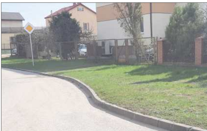
Budowa nawierzchni chodników na os. Parkowa, os. Huta, os. Szkolna w Grajewie

Wartość inwestycji to 88 tys. zł. Ta została podzielona na 3 części. Prace przewidziane są na ulicach: Parkowej, Lipowej, Wyzwolenia, Pęży oraz Wąskiej.