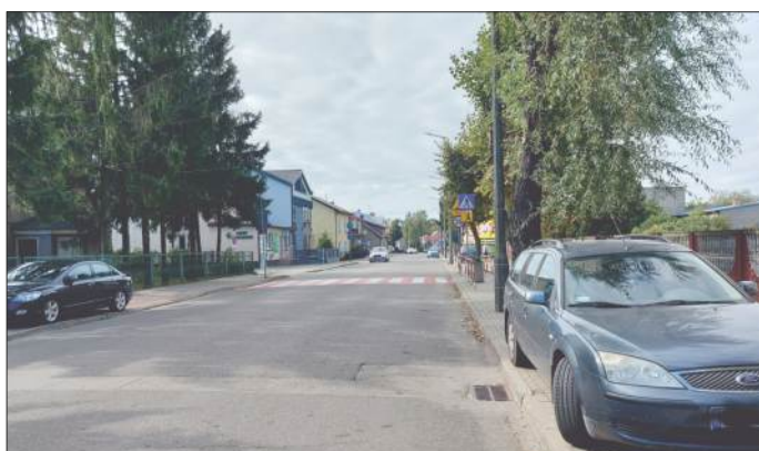
Ul. Konstytucji 3 Maja, na przeciwko wejścia do Szkoły Podstawowej nr 4 przy skrzyżowaniu z ul. Skośną