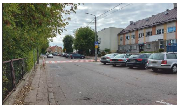
Ul. Szkolna, na przeciwko wejścia do Szkoły Podstawowej nr 1 przy wejściu na kładkę prowadzącą nad torami kolejowymi

Mówię TAK DRODZE S16 Elk-Prostki-Grajewo-Szczuczyn-Goniądz-Mońki-Knyszyn