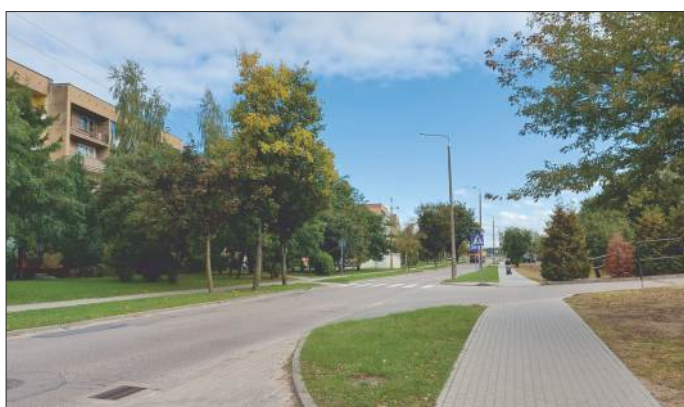
Ul. 9 Pułku Strzelców Konnych w bezpośrednim sąsiedztwie placówki handlowej wielkopowierzchniowej (sklep Biedronka)