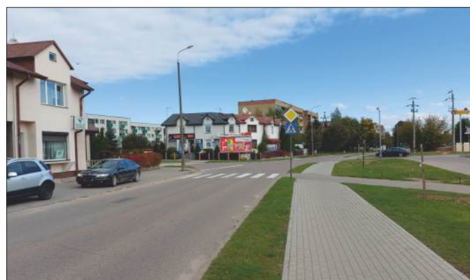
Ul. 9 Pułku Strzelców Konnych w bezpośrednim sąsiedztwie placówki handlowej wielkopowierzchniowej (sklep Lidl)